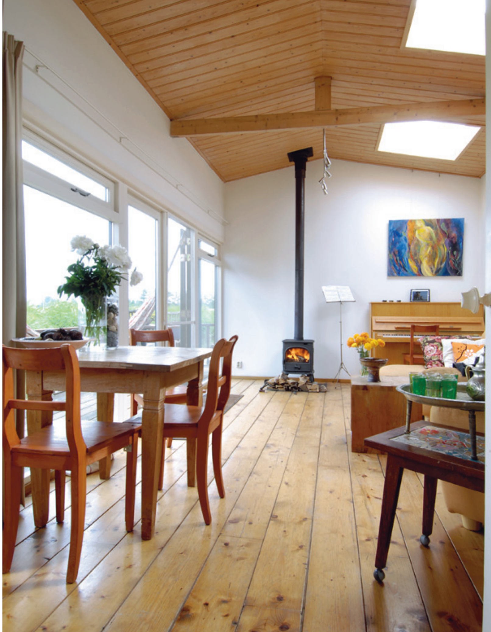
1 Een prachtige schelpenverzameling uit Griekenland, Hongkong, Spanje en Texel." 2 "We nemen altijd olijfolie mee uit landen waar we zijn geweest." 3 "Snoet ligt heerlijk op ons bed." 4 "Voor mijn werk til ik me een breuk aan mijn zware cameratas, dus 's avonds gaat mijn charmante Leica camera in retrostijl om de nek." 5 "Toen we op Bali waren, reden we op de scooter voorbij een plek waar ze afgedankte boeddhabbeeldjes van hout weggooiden. Die vonden wij wél mooi en we namen ze mee. De locals lagen in een deuk!" 6 "Dit is een antieke spekkast." 7 "In de zijkamer hebben we de hoogte goed benut door de hele wand met steigerhout te betimmeren tot kledingkast. Een trap heb je absoluut nodig." 8 "De slaapkamer ligt onder het waterniveau. De blauwgroene kleur op de wand is de start van de metamorfose." 9 "Hand met lekkers." Rechts: "De woonkamer oogt heel ruimtelijk door de hoogte. Alleen de haard en piano staan tegen de muur waardoor er genoeg plek is voor prachtig licht van buiten op de muur."

Tekst & styling: Isabelle van der Horst.